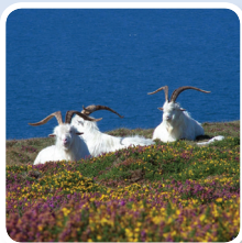
Geifr y Gogarth Great Orme goats

Dyma'r llwybr cyflymaf a hawsaf i'r copa. Mae tua 1 milltir o hyd a dylai gymryd tua 1 awr i chi. Mae'r arwyddbyst yn dilyn cod lliw gwyrdd. ■ Ewch o Prince Edward Square a cherddwch ar hyd Rhodfa'r Eglwys a phasio Gorsaf Dramiau Victoria. ■ Cymerwch yr ail droad i'r dde, heibio'r orsaf dramiau a dilynwch yr arwyddion am Erddi Haulfre. Byddwch yn gweld arwyddbost y man cychwyn ar ochr chwith y ffordd, yn y gwely blodau union o flaen Ystafell De Haulfre a gyferbyn â'r toiledau cyhoeddus. ■ Ewch i fyny'r llwybr a'r grisiau sy'n ymdroelli drwy'r gerddi tan i chi gyrraedd giât sy'n arwain at y cwrs golff mini. ■ Ewch drwy'r giât a dilynwch yr arwyddbyst sydd ger y llwybr, i fyny heibio ymyl y cwrs ac at giât. ■ Trowch i'r dde pan fyddwch yn cyrraedd Llwynon Road a chroeswch y ffordd. ■ Trowch i'r chwith i fyny'r llwybr gyda grisiau, rhwng y tai sy'n arwain at Tyn y Coed Road. ■ Trowch i'r dde a chroeswch y ffordd eto ac edrychwch am lechwedd sy'n mynd i fyny ac i'r chwith tuag at gyfres o risiau. ■ Dilynwch y llwybr hwn tan i chi gyrraedd Teras Bryn Eisteddfod a throwch i'r dde unwaith eto. ■ Dilynwch y ffordd tan i chi gyrraedd troad i'r chwith i Pyllau Road. Dilynwch Pyllau Road gan fynd trwy giât ymhen ychydig ac yna hebio mynedfa Mwynglawdd Copr y Gogarth. ■ Dilynwch yr arwyddbyst ac yn funn byddwch yn gallu gweld y copa i fyny'r bryn tua'r dde.