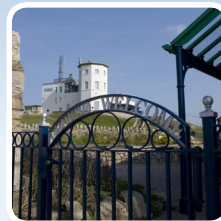
Ganolfan Ymwelwyr Visitor Centre

This route is the quickest and easiest walk to the summit. It is approximately 1 mile long and should take you about 1 hour. The waymarker posts are colour coded olive green. ■ To start the trail from Prince Edward Square, walk along Church Walks passing the Victoria Tram Station. ■ Take the second turn on the right past the tram station, following the signs for Haulfre Gardens. You will see the start waymarker post on the left side of the road in the flower bed just before the Haulfre Tearooms and opposite the public toilets. ■ Go up the paths and steps which wind up through the gardens until you reach a gate leading onto the miniature golf course. ■ Go through the gate and follow the waymarker posts along the path up the side of the course to a gate exit at the top. ■ Go through the gate and turn right when you reach Llwynon Road and cross over. ■ Turn left up the stepped alleyway, between the houses, leading to Tyn y Coed Road. ■ Turn right and cross the road again and look for a slope going uphill and left leading to a set of steps. ■ Follow this track until you reach Bryn Eisteddfod Terrace and again turn right. ■ Follow the road until you reach a sharp left turn onto Pyllau Road. Follow Pyllau Road passing through a gate after a short while, and then past the entrance to the Great Orme Copper mines. ■ Follow the waymarker posts and you will soon be able to see the summit up the hill to your right.